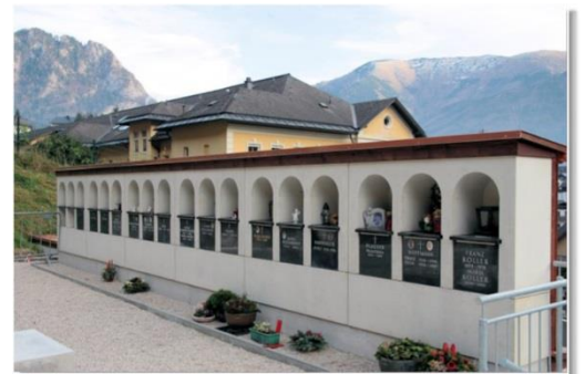
Bsp.: Urnenwand (Fertigteil)